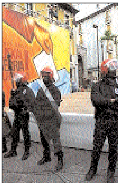
Agenti della polizia autonoma basca, l'Ertzaintza, impediscono un meeting che doveva celebrare la nuova assemblea di eletti ed elette di Autodeterminaziorako Bilguneak.

La Commissione di Garanzia lavora affinché vengano rispettate tutte le scelte politiche