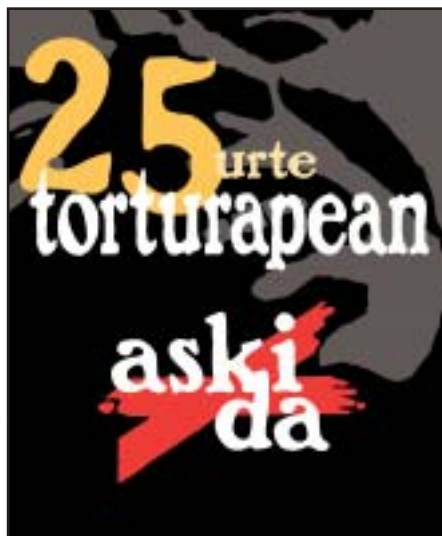
25 años de tortura, ¡basta ya!

que aproximadamente el 95% han denunciado haber sufrido malos tratos o torturas. Así pues, la constitución no ha garantizado que dicha práctica no exista, por