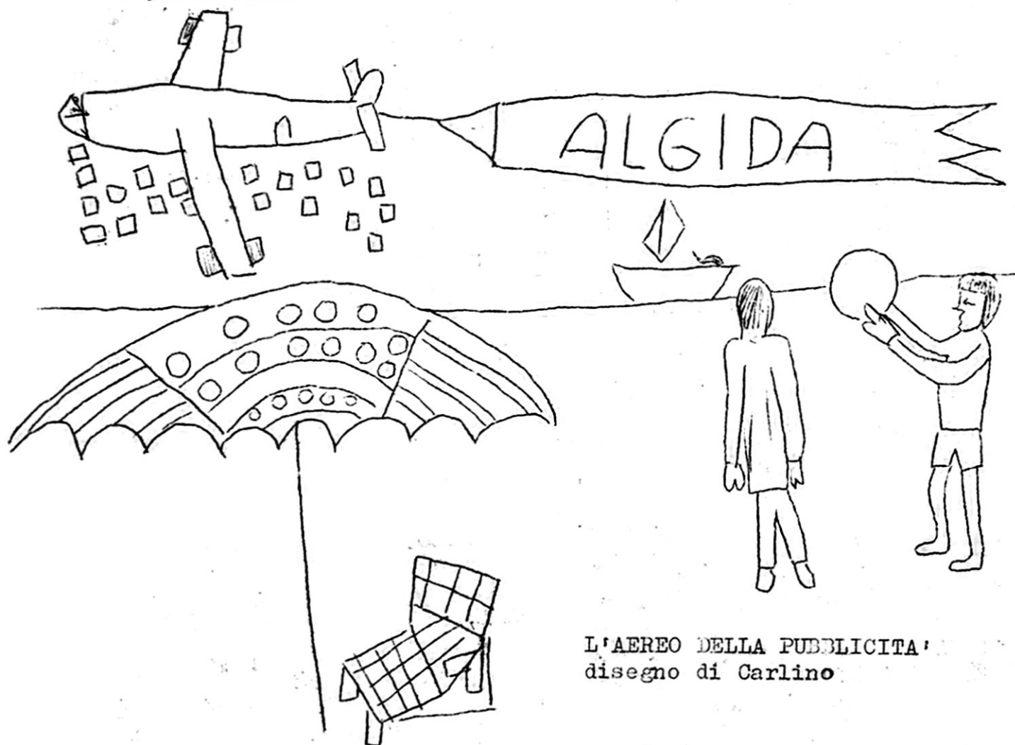
L'AEREO DELLA PUBBLICITA' disegno di Carlino

Giornalino della Scuola di Vho di Piadena (CR), classe V E' quasi quotidiano e aperto a tutti. Descrive la vita dei bambini e i problemi della gente. In questo numero: inizia la nostra indagine sulla pubblicità.